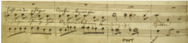
Tamino's Auftrittsarie mit verändertem Text (Ausschnitt) Weimarer Fassung von Mozarts Zauberflöte

Das B.A.-Ergänzungsfach Musikwissenschaft bietet sich insbesondere für Tätigkeiten im Kulturbereich als Kombinationsfach für Kunstgeschichte, Literaturwissenschaft, Kulturwissenschaft/ Volkskunde, Philosophie oder Geschichte an.