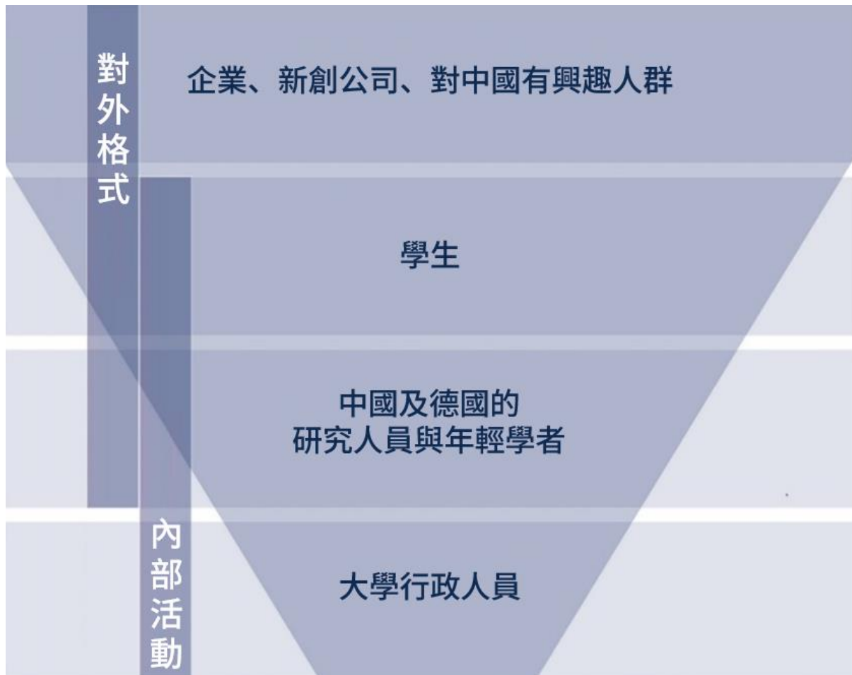
圖表一：計畫措施的廣泛影響

此計畫的目標群體包含行政人員、研究人員與年輕學者、學生、教師及所有對創立學術機構有興趣的人們。